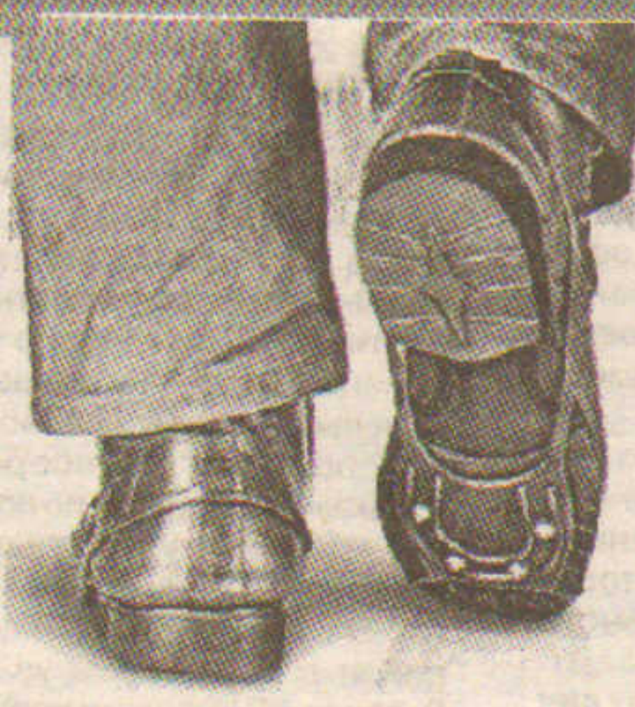
К СЛОВУ Прикреплять «снегоходы» к обуви на высоком каблуке не стоит.

Прозрачные накладки на подошву с противоскользящим рельефом не так видны и вполне эстетичны.