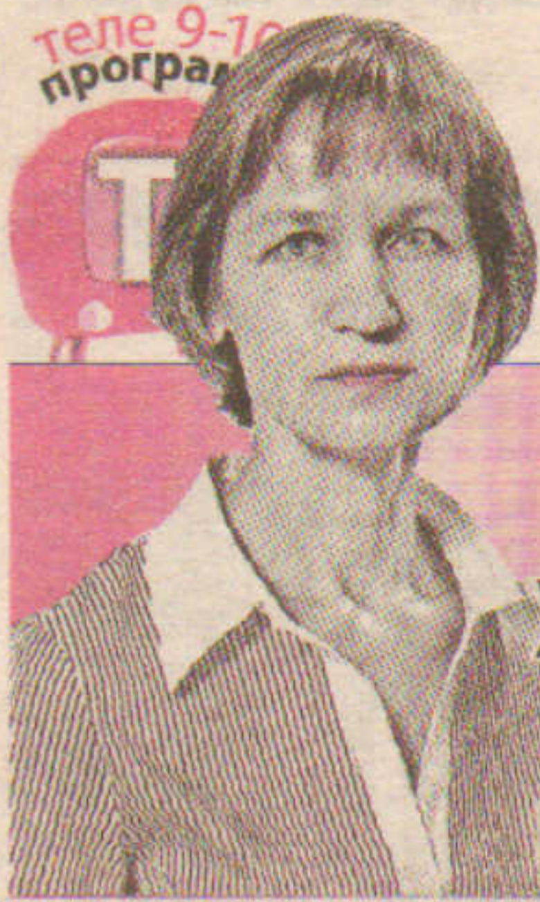
Хрещен чунла историк