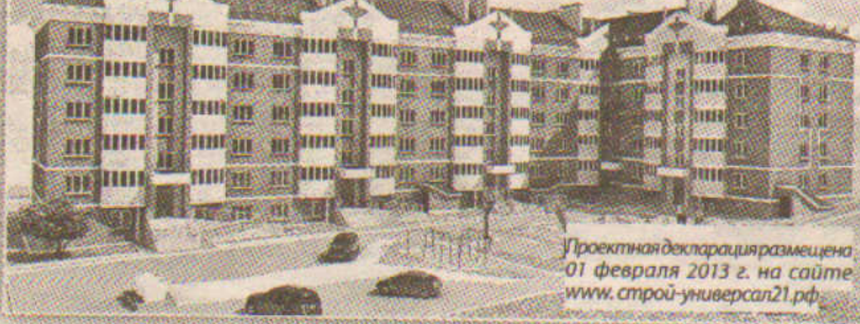
Проектная декларация размещена 01 февраля 2013 г. на сайте www.строй-универсал21.ru

ООО «Строй-Универсал» сообщает о начале строительства «Многоквартирного жилого дома переменной этажности, 5-6 этажей, с офисными помещениями по ул. Первомайская в поселке Чебоксарского района Чувашской Республики».